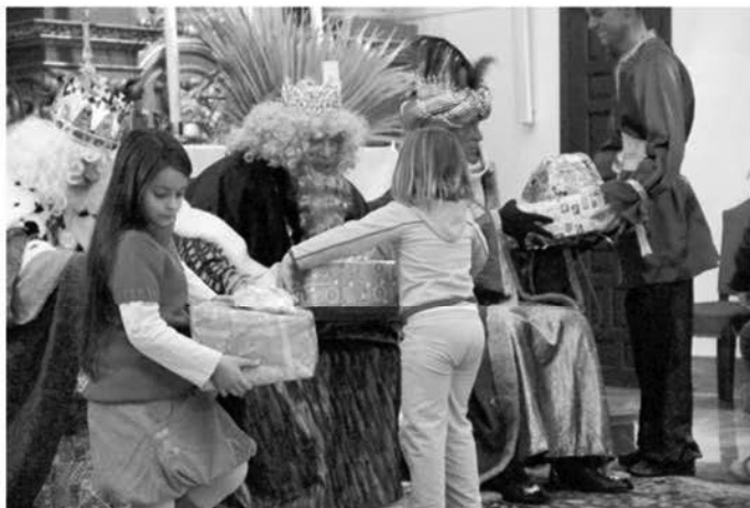
Los pequeños recibieron sus regalos de manos de los Reyes Magos.