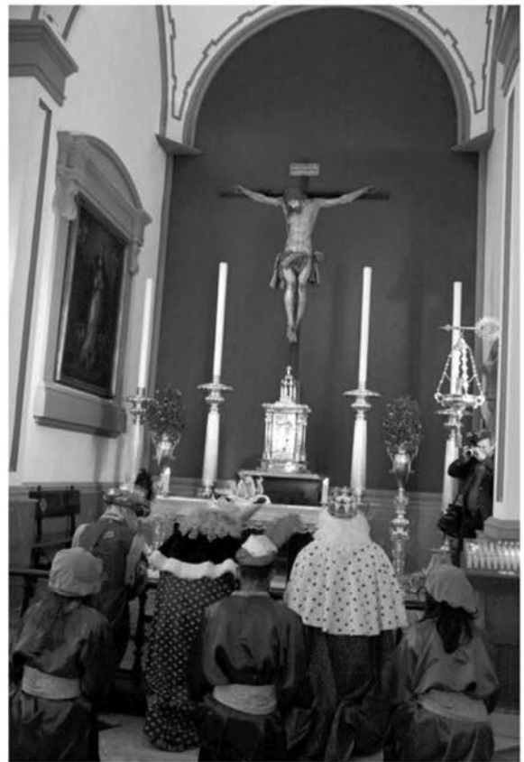
Los Reyes adoraron al Niño Jesús en la Capilla Sacramental

La colaboración prestada por los hermanos y amigos de la Archicofradía para esta obra de fraternidad ha supuesto la inversión de 10.220 euros.