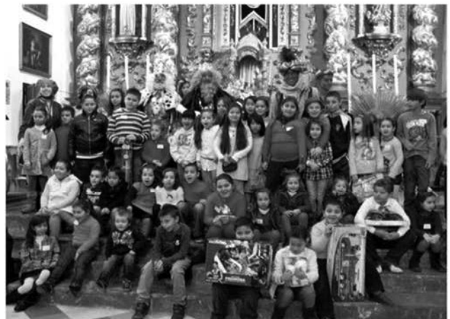
SS.MM. posaron gentilmente con un grupo de niños al final del acto.