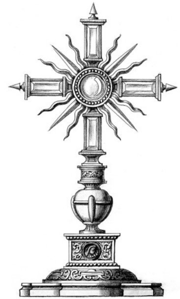
SOLEMNE MISA DE DIFUNTOS

El próximo sábado 31 de octubre la Archicofradía ha organizado y programado una función benéfica en la que la compañía "Teatro y aparte" nos representará de forma desinteresada su obra "Como suena, Sr. Presidente". El evento tendrá lugar en el auditorio de la Diputación de Málaga en calle Pacífico, cedido para tal fin. El precio de las entradas es de 5€ y se podrán adquirir en la Casa Hermandad o hacer las reservas en el teléfono 952 219 243.