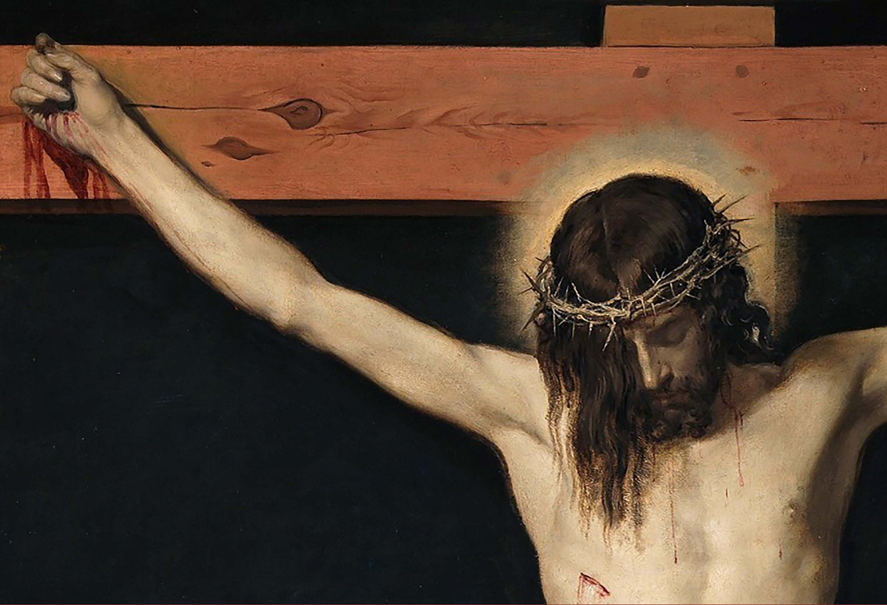
Cristo Crucificado (detalle). Hacia 1632. Diego Velázquez. Museo del Prado. Madrid.