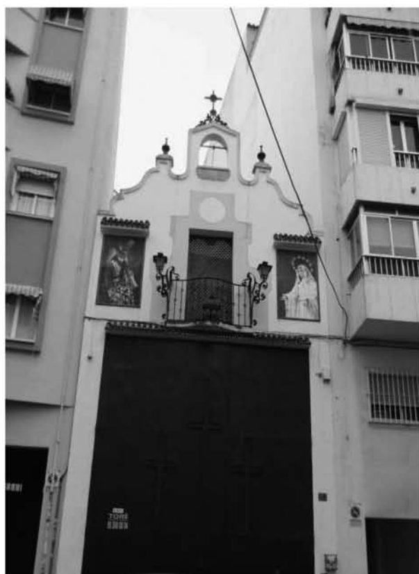
Calle Amargura 10, una casa para ejercitar la hermandad.

El sistema de funcionamiento del Economato consiste en la venta de productos de alimentación, higiene y limpieza doméstica, todos de primera necesidad y todos ellos expendidos siempre a precio de coste, sin recargo alguno. El Economato, gestionado únicamente por voluntarios de las cofradías, sólo atenderá y venderá sus productos a personas previamente acreditadas por cada hermandad como «beneficiarias» en razón de su estado de necesidad, las cuales sólo deberán abonar de sus propios recursos el 25% de sus compras, pues el 75% restante será financiado por aquella cofradía que haya acreditado a ese beneficiario.