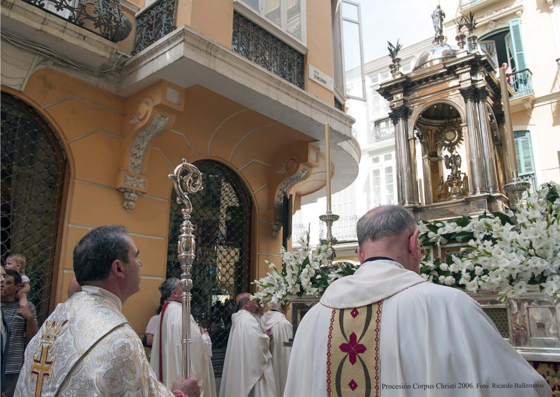
Procesión Corpus Christi 2006.