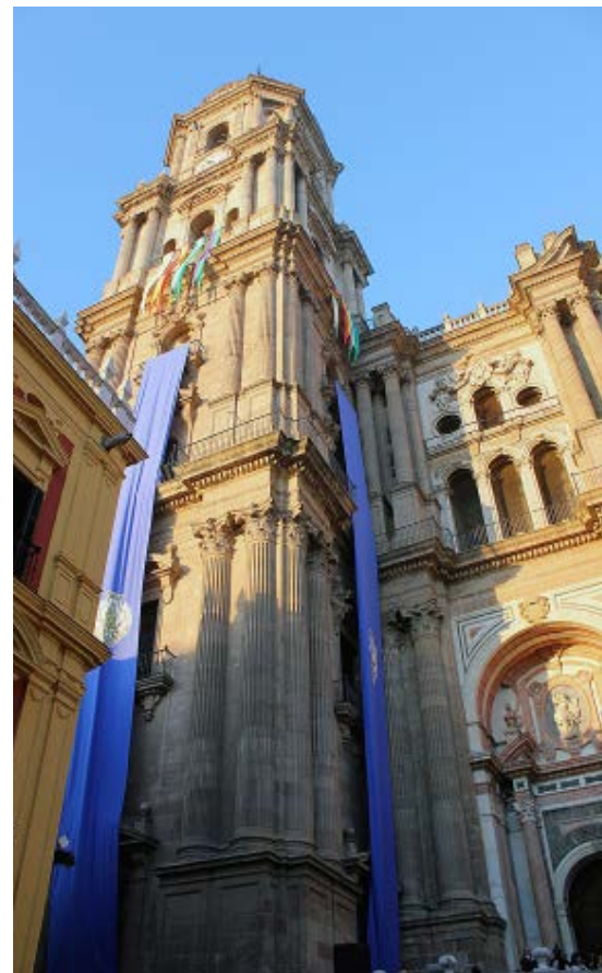
Arriba, torre de la Catedral engalanada.