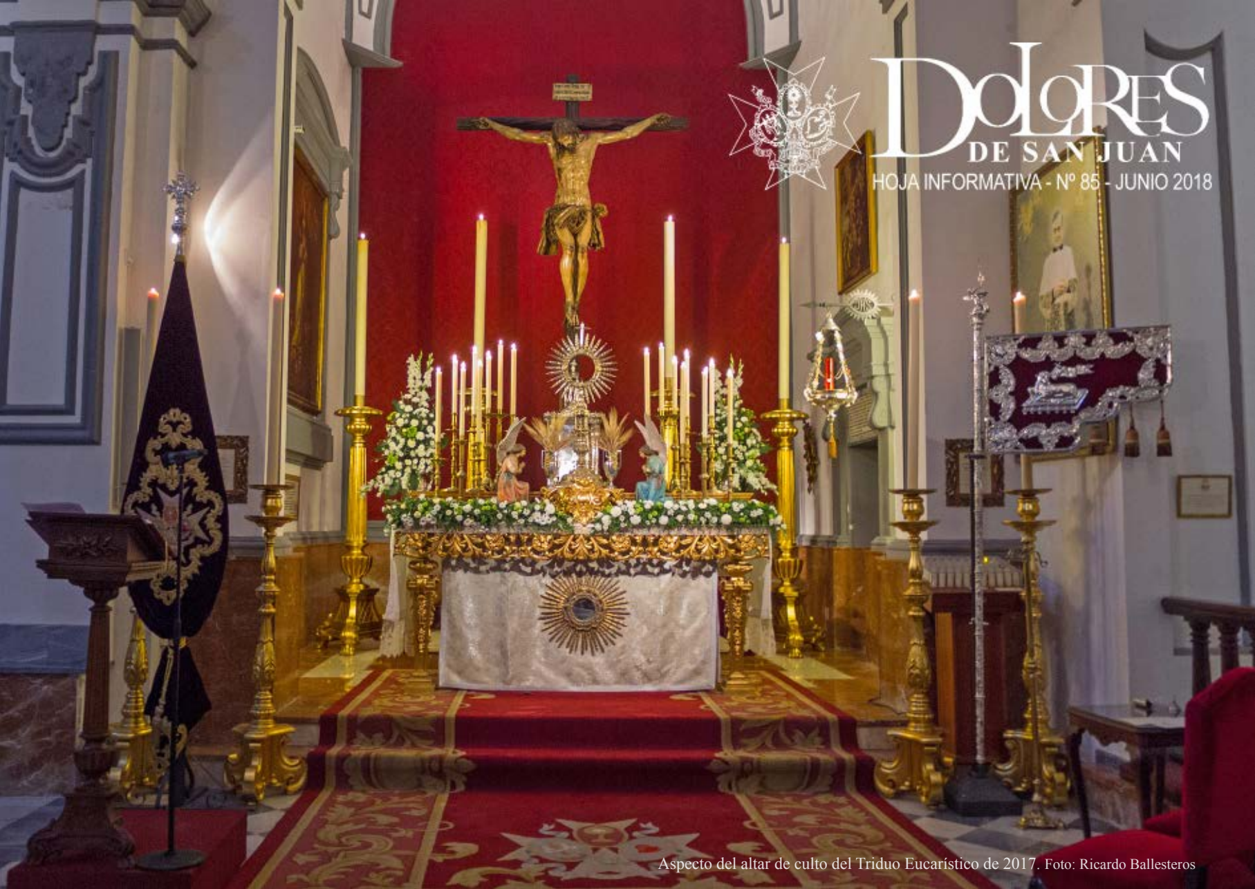
Aspecto del altar de culto del Triduo Eucarístico de 2017.