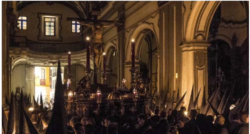
A la derecha, foto: Julio Bravo