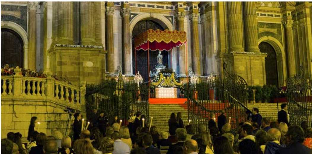
Arriba, a la izquierda, momento en que se recibía a María Auxiliadora en la puerta de la Parroquia de San Juan.