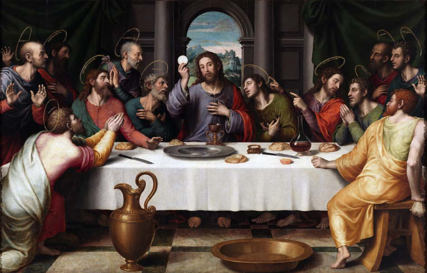
Sagrada Cena. Entre 1555 y 1562. Juan de Juanes.