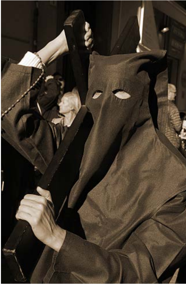
Arriba, fotos: Eduardo Nieto