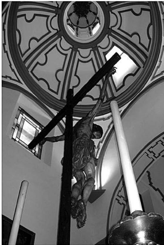
Cristo es Amor y Servicio. Él se entregó hasta la muerte.

No pocos, como el apóstol Santo Tomás, «porque han visto, han creído». Cuando surgió la idea de montar un «economato cofrade» para alimentar a necesitados, bastantes pensaron que todo se diluiría, dada su patente dificultad. Otros, gracias a Dios, apostamos por un proyecto eclesial por fraterno y comunitario y al par muy eficaz. Así, la Fundación Corinto agrupa hoy a las 20 cofradías fundadoras, una asociada y otra colaboradora, mientras otras dos más estudian sumarse. Un centenar de voluntarios, algunos de nuestra Archicofradía, atienden cada martes o jueves a 300 familias que suponen 1.000 personas. Todo en sólo siete meses de apertura efectiva tras un año de preparativos.