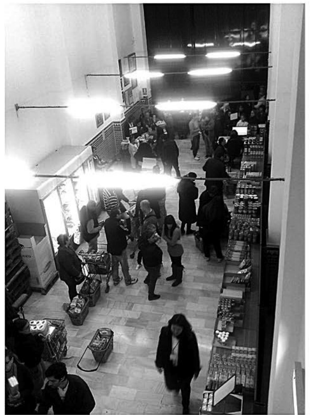
La Fundación Corinto abre cada martes y jueves por la tarde.

Las aportaciones de los sólo 25 suscriptores «padrinos» con que cuenta la Bolsa de Caridad de la Archicofradía es lo que permite financiar estas ayudas. Únicamente contando con más «padrinos» podremos extender y aumentar este auxilio de primera necesidad que cada día nos solicitan más familias.