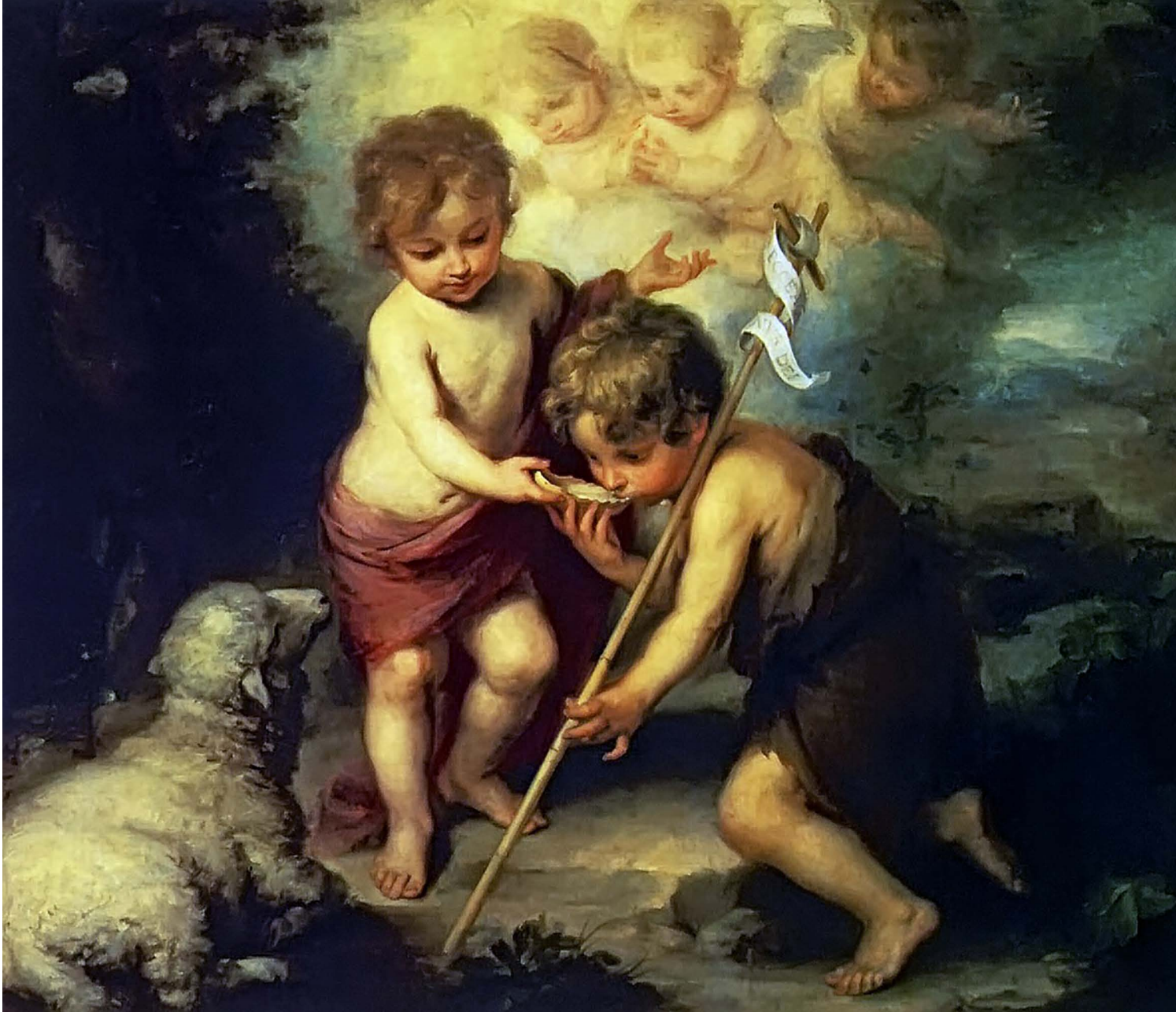
Jesús y Juan Bautista niños. Bartolomé Esteban Murillo.