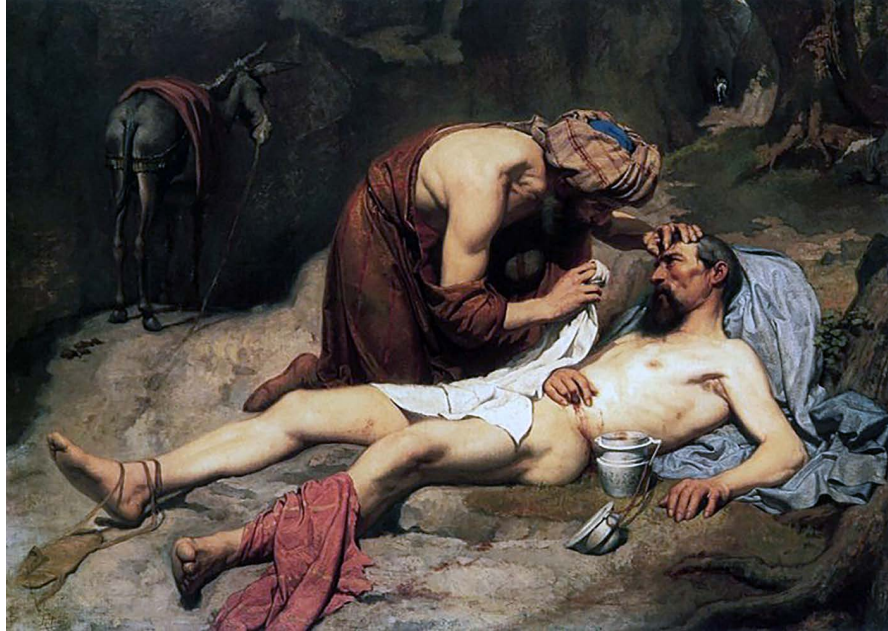
El Buen Samaritano. Teófilo Patini.