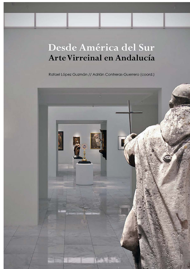
Cartel publicitario de la exposición.