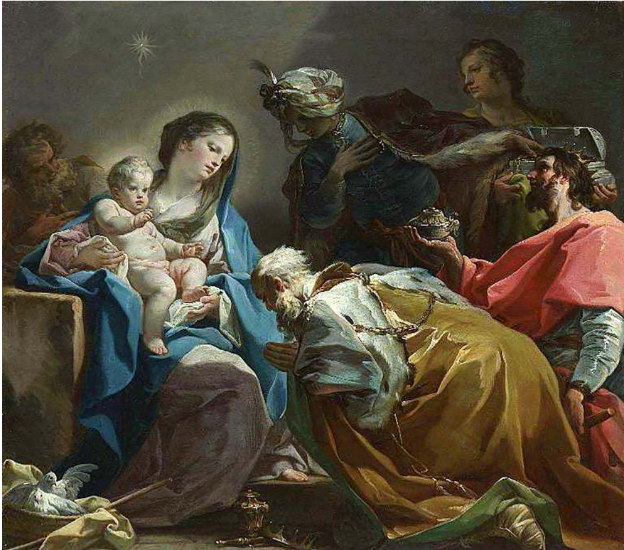
Adoración de los Magos. Corrado Giaquinto.

En estas fechas se lleva a cabo la Cuestación anual Pro Cáritas, que tendrá lugar el sábado 16 de diciembre, y a la que os invito que participéis, sobre todo con los más pequeños. Será un bonito día para reflexionar, para hacer algo por aquellos de los que nadie se acuerda, para parar en medio del lío de las fiestas y dedicar un rato a compartir con los demás.