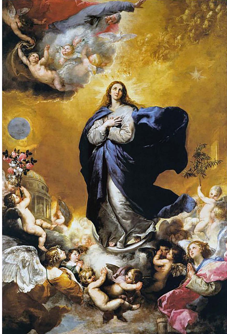
La Inmaculada Concepción, Rivera.