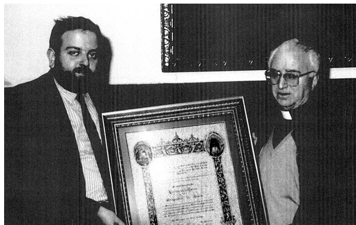
Entrega nombramiento Hermano de Honor.