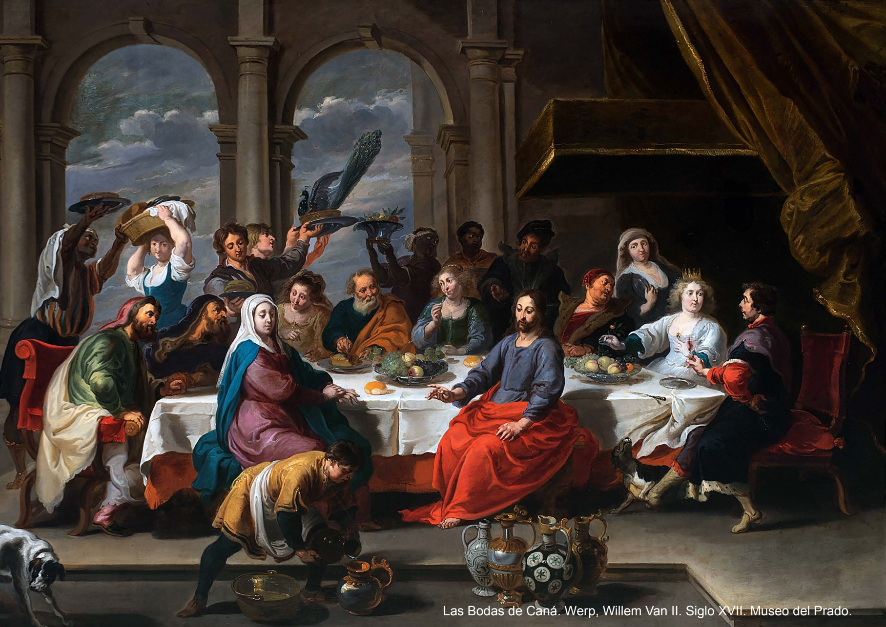
Las Bodas de Caná. Werp, Willem Van II. Siglo XVII. Museo del Prado.