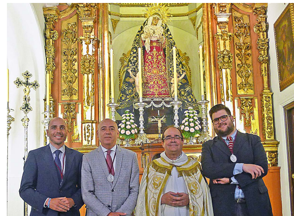
En los extremos de la fotografía, los dos nuevos directivos.