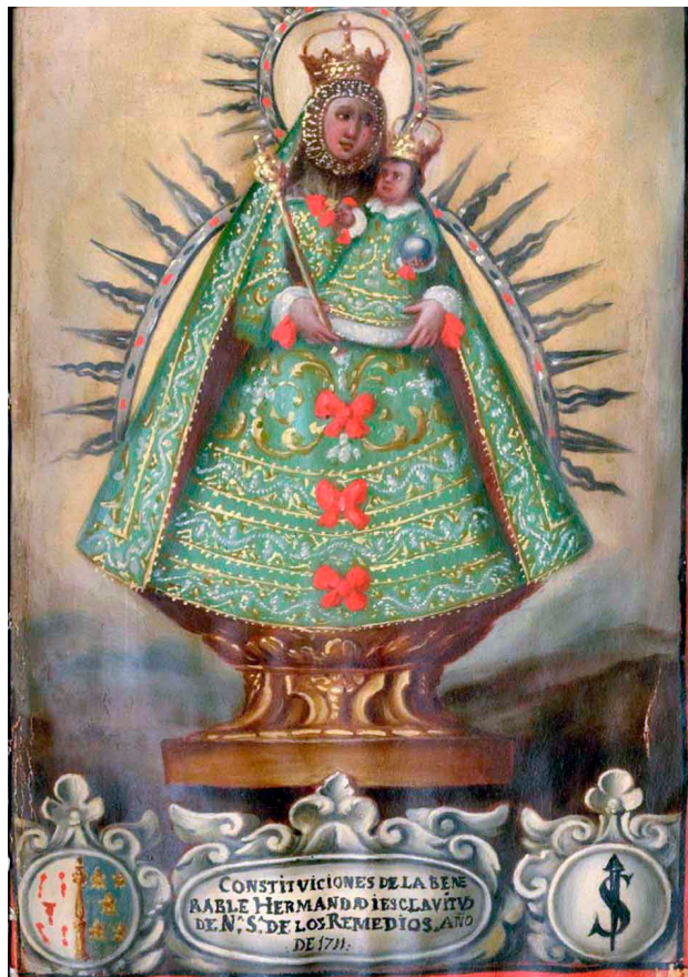
Grabado del siglo XVIII, motivo del cartel anunciador del ciclo.

portancia de nuestro Archivo Histórico para su inclusión en dicho programa. Ahora esperamos contar con vuestra presencia a dicho acto, al que estáis todos invitados junto a vuestra familia y amigos.