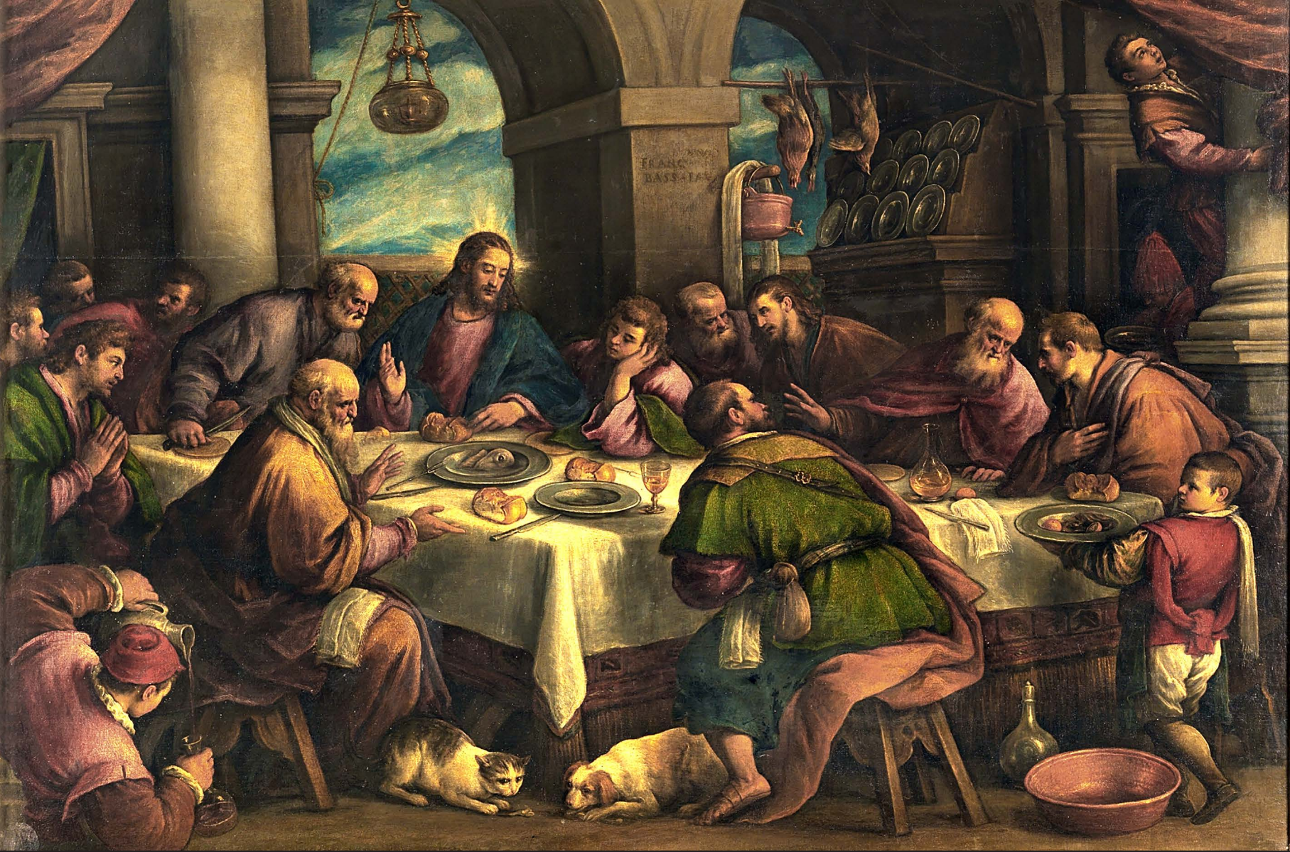
La Última Cena. Francesco Bassano El Joven (1586). Museo del Prado.