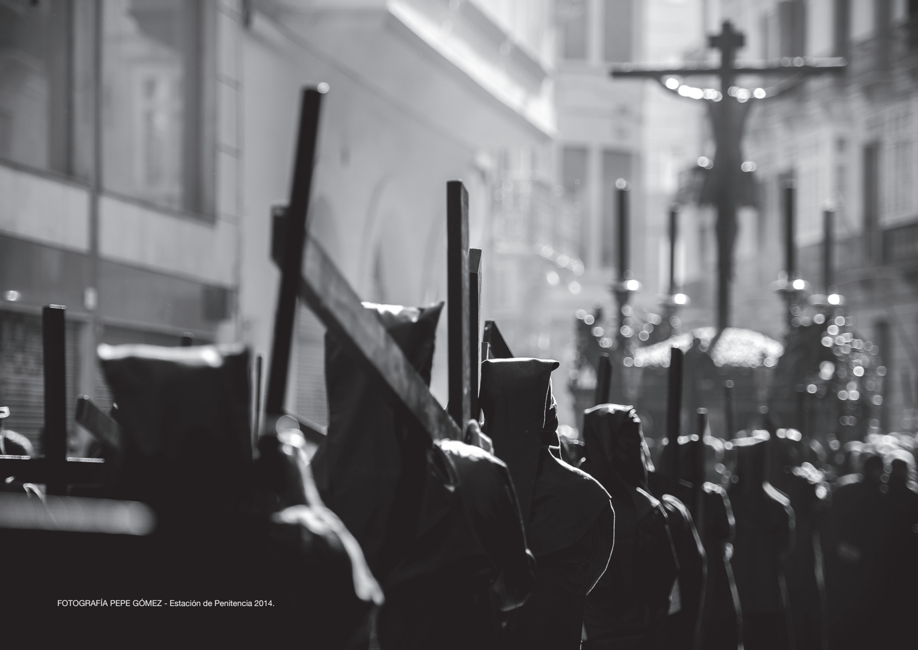
Estación de Penitencia 2014.