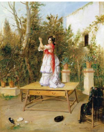
Óleo: "Bailando", del pintor Manuel Cabral Aguado Bejarano, de la colección Carmen Thyssen. Cuadro que sirvió de inspiración para una escena del Belén, como abajo se reproduce.