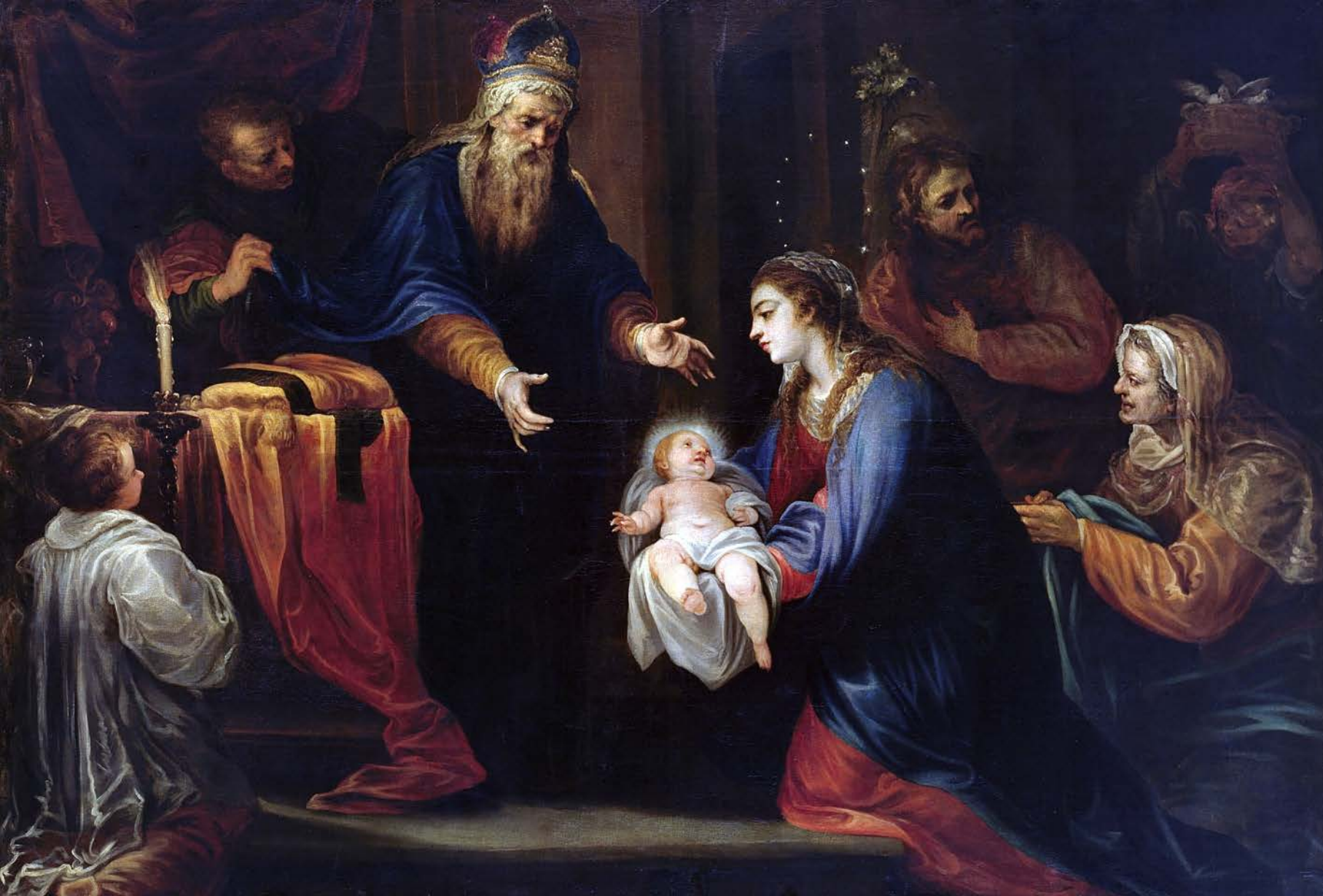
La Presentación de Jesús en el Templo (Primer Dolor de la Virgen). Francisco Rizi (1663). Museo del Prado.