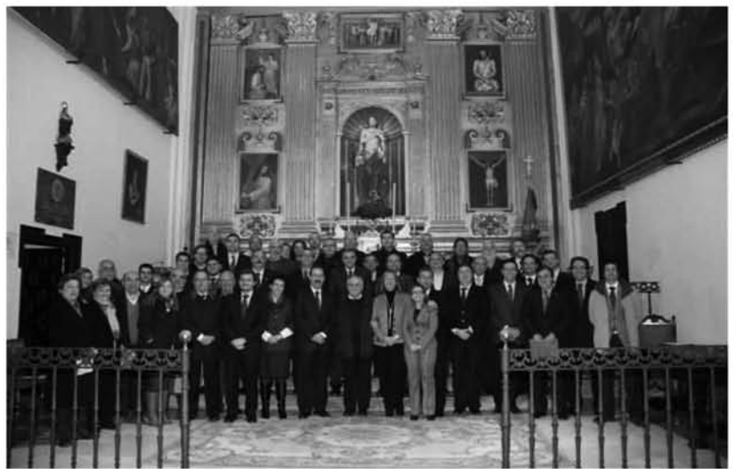
Cofrades de las 20 hermandades que acordaron crear el Economato en diciembre.

El sistema de funcionamiento mercantil y práctico del Economato consiste en la apertura de un establecimiento para la venta de productos de alimentación, higiene y limpieza doméstica, todos ellos de primera necesidad y todos ellos expendidos siempre a precio de coste, sin recargo de tipo alguno. El Economato, gestionado únicamente por voluntarios de las cofradías, sólo atenderá y venderá sus productos a personas previamente acreditadas por cada hermandad como «beneficiarias» en razón de su estado de necesidad, las cuales sólo deberán abonar de sus propios recursos el 25% de sus compras, pues el 75% restante será financiado por aquella cofradía que haya acreditado a ese beneficiario.