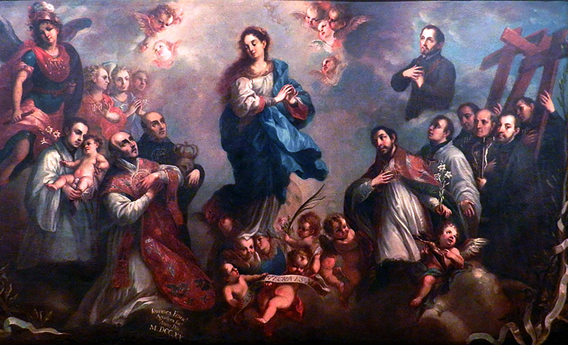
La Purísima Concepción con jesuitas. Juan Francisco de Aguilera (1720). Museo Nacional de Arte de México.