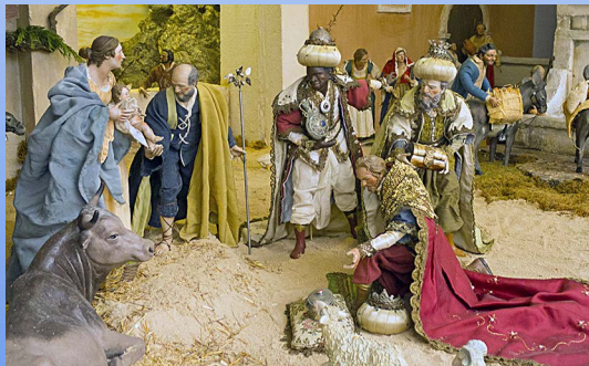
Belén del pasado 2017 (detalle).

Los lunes suele permanecer cerrado por descanso del personal del Museo.