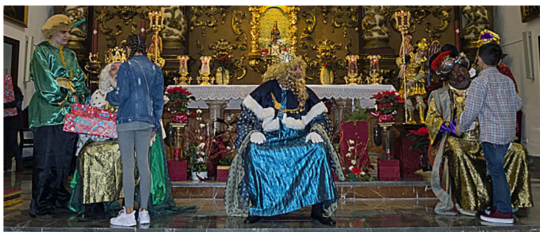
Día de Reyes de 2018.

(Más información de los actos en páginas de esta Hoja Informativa)