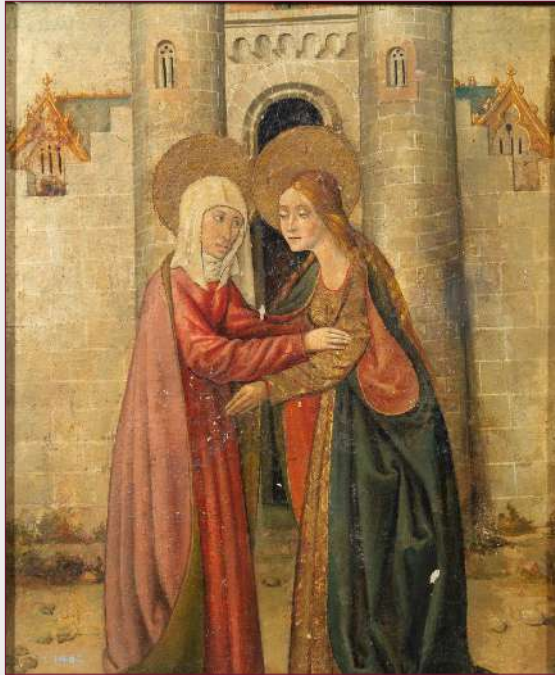
La Visitación. Tabla anónima, siglo XV. Museo del Prado.

Podemos tomar como punto de partida la palabra Adviento; este término no significa espera, como podría suponerse, sino que es la traducción de la palabra griega parusía , que significa presencia, o mejor dicho, llegada, es decir, presencia comenzada.