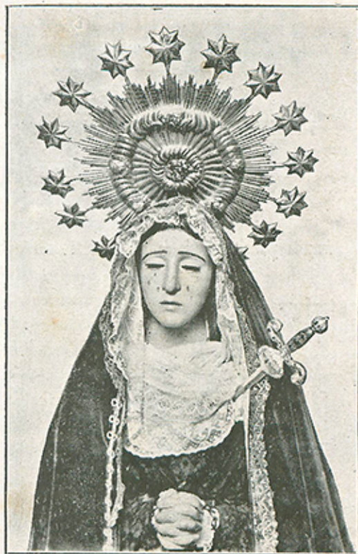
NTRA. SRA. DE LOS DOLORES EN SAN JUAN