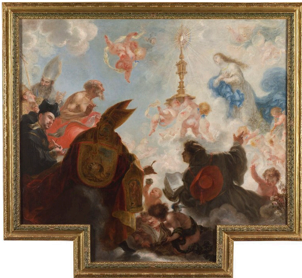
Triunfo del Sacramento Francisco de Herrera el Mozo, 1656