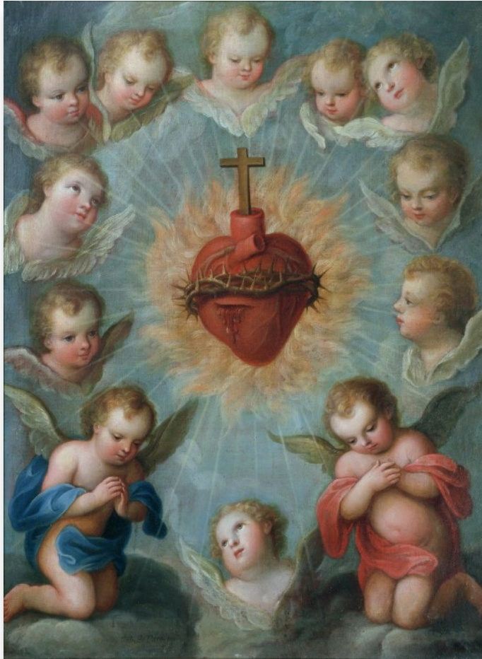
Sagrado Corazón de Jesús, rodeado de ángeles. José de Páez, 1775.