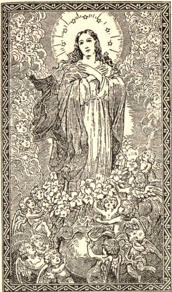
NO HAY EN TI CULPA ORIGINAL