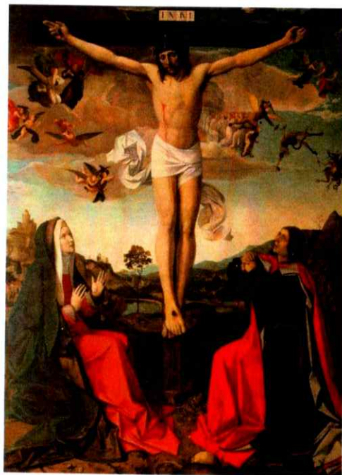
Josse Lieferinxe. M. Louvre