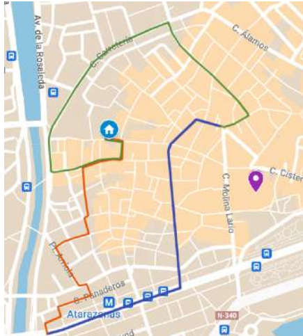
Itinerario de 1986 Salida 20:00 A su templo 01:00 Duración 5 h. 00 min. Distancia 2920 m.