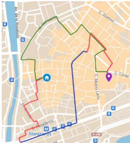
Itinerario de 1993 Salida 19:45 A su templo 02:30 Duración 6 h. 45 min. Distancia 3214 m.