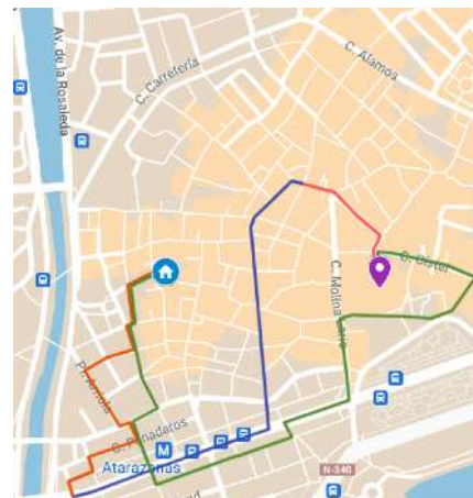
Itinerario de 1994 Salida 20:00 A su templo 02:45 Duración 6 h. 45 min. Distancia 3131 m.

Por lo demás, este itinerario se mantendrá estable durante todo el período con leves cambios de horario o de recorrido, como el de la ida y la vuelta por calle San Juan y plaza de Félix Sáenz en lugar de por Calderón de la Barca y Fernán González, o el paso por Strachan y Bolsa hacia Sancha de Lara, con la finalidad de ajustarlo a nuestro ritmo de paso.