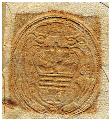
2. Sello del Obispo de Málaga fray Francisco de San José

establece que el mencionado Lignum Crucis de sor Mariana de Austria, se expusiera en la capilla del Santísimo Sacramento de la iglesia de San Juan de Málaga los días de la Santa Cruz, Jueves y Viernes Santo [2].