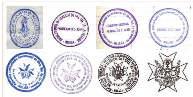
5. Sello de la Archicofradía, 1891.

Las dos orlas concéntricas se convertirán en tres al alargarse el título de la Archicofradía con la inclusión de la denominación de pontificia en el año 2001. El campo también cambia, presentando la Cruz de Malta monócroma e incluyendo una filacteria con la leyenda "Nobis natus nobis datus ex Maria Virgine". La impronta de este sello de escritorio de madera, que se ha conservado, es la que se utiliza actualmente mediante sello autoentintable [11]. Quizá esta densidad de texto propició la utilización de un sello, que también se conserva, cuya impronta es el escudo de la Archicofradía sin orlas de textos, formando su contorno los brazos de la Cruz de Malta. Más limpio y elegante este segundo, que sugerimos podía mantenerse y utilizarse conjuntamente con el anterior, dedicándolo al sellado de diplomas, patentes de hermano, papeletas de sitio, nombramientos y otros documentos de carácter interno que no precisen de la formalidad oficial del abultado título de la Archicofradía [12].