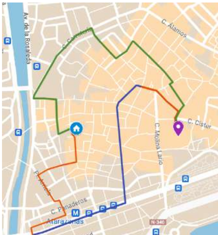
Itinerario de 2017 Salida 17:50 A su templo 23:30 Duración 5 h. 40 min. Distancia 2933 m.