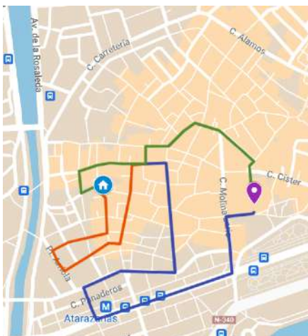
Itinerario de 2024 Salida 19:05 A su templo 00:35 Duración 5 h. 30 min. Distancia 2687 m.

En cualquier caso, es la época de itinerario más reducido y con menos tiempo en la calle, como en la Semana Santa de 1998, cuyo recorrido es de 2.520 metros (700 metros menos que en el anterior período) y la duración de la estación de penitencia es de cuatro horas y cuarenta minutos . También se va a producir la recogida más temprana, a las 22.30 horas.