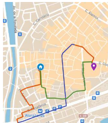
Itinerario de 1998 Salida 17:50 A su templo 22:30 Duración 4 h 40 min. Distancia 2521 m.