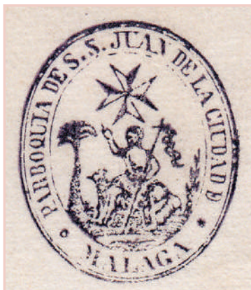
4. Sello de la parroquia de San Juan Bautista de Málaga (desde 1930).