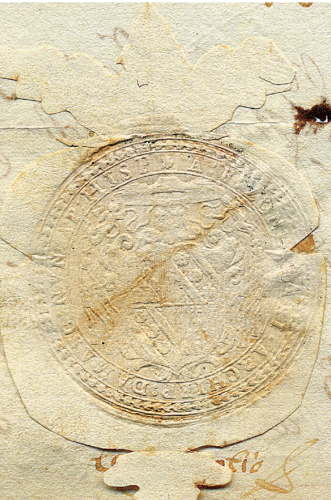
1. Sello del Arzobispo Antonio César Zondadari