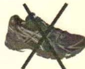
NO A BOTAS, CALZADO CON TACONES O DEPORTIVO

Tanto los nazarenos como los hombres de trono se abstendrán de llevar a la vista cualquier adorno, piercing, pulsera o anillo, a excepción de la alianza matrimonial. Igualmente las hermanas participantes evitarán usar maquillaje o esmalte de uñas.