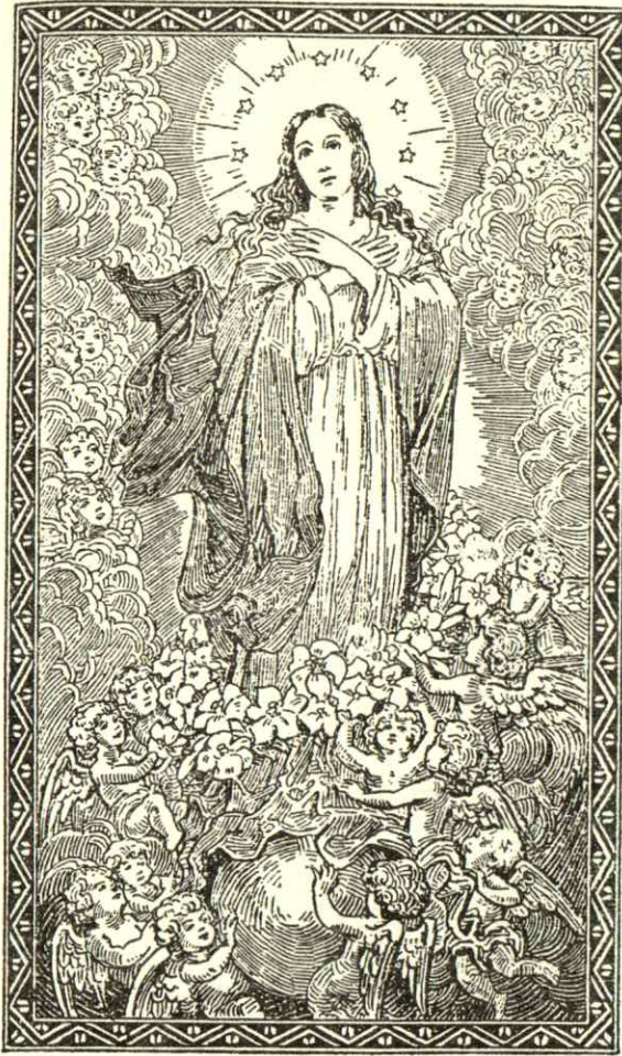
NO HAY EN TI CULPA ORIGINAL