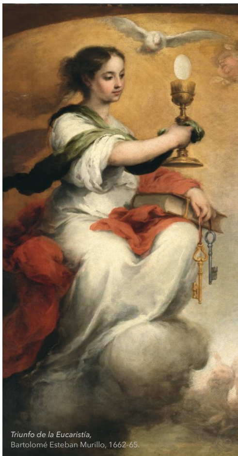
Triunfo de la Eucaristía, Bartolomé Esteban Murillo, 1662-65.