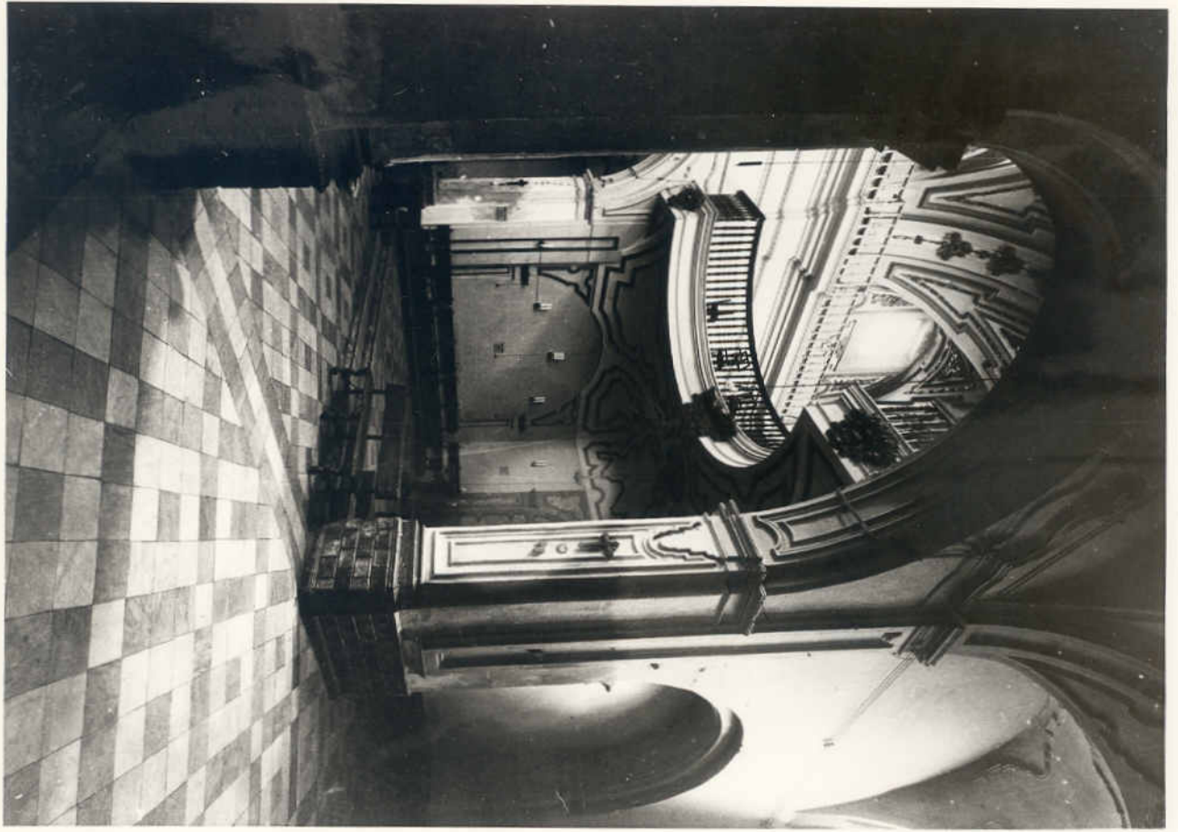
Parroquia de S. Juan. México Fotografías n.º 3864 Avenida Tenancingo.